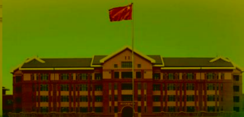
天津机电职业技术学院

TIANJIN VOCATIONAL COLLEGE OF MECHANICAL AND ELECTRICAL ENGINEERING